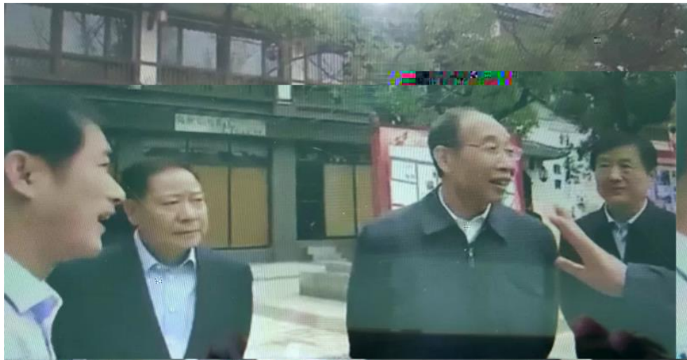
刘奇在江西调研时强调： 深入学习贯彻党的十九届四中全会精神 加强和改进新时代统战工作 高翔炯随同调研 刘奇在南昌陪同调研